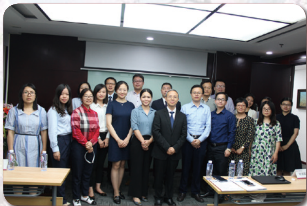
▲ 2019年6月12日下午，由中伦文德法律研究院主办的“2019年企业合规管理体系构建研讨会”在中伦文德律师事务所北京总所第八会议室举行。与会嘉宾有来自新能源企业、电力企业、煤炭企业、医疗企业、税务咨询机构以及中央直属事业单位的主要领导和业务骨干。