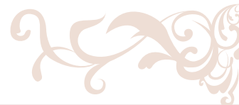
Table of Contents