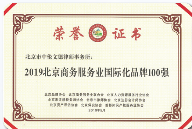
▲ 北京品牌协会、北京商务服务业联合会等九家协会联合发布“2019北京商务服务业创新品牌和国际化品牌百强榜单”。中伦文德律师事务所荣获“2019北京商务服务业国际化品牌100强”称号。